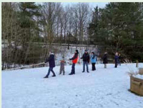
... beim Tauziehen war es dann schon etwas kälter!

ar hat die Winterwanderung Spezial im Rahmen des Aktivtages des KSB stattgefunden. Bei Minusgraden und Schnee und Eis hatten sich Aktive am Haus am See eingefunden. Auf der Wanderung in „dicken Botten“ und mit Schlitten rund um das Baggersee-gelände wurden die Teilnehmer in die Historie des Baggersees eingeweiht. Zum Abschluss gab es noch einen Wettbewerb im Tauziehen und auch im Werfen von Frisbeescheiben konnten