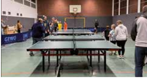
Riesenrundlauf beim Weihnachtsabschluss

ein. Bei Kinderpunsch, weihnachtlicher Musik, ein wenig Süßigkeiten und Tischtennis kam das Jahr 2023 für unsere Jugend zu einem würdigen Abschluss. Und es dauerte auch nicht lange, da griffen auch die Eltern zum Schläger und forderten unseren Nachwuchs zum Riesen-Rundlauf um mehrere Platten heraus.