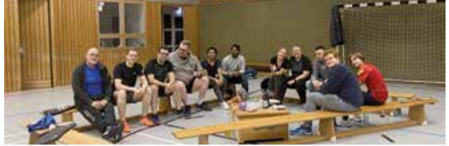
Weihnachtsfeier in Otter

Kurz vor Weihnachten, am Freitag, 22.12.23 fand in Otter eine äußerst lustige und fröhliche Weihnachtsfeier in der Sporthalle statt. Neben den regulären Spielen