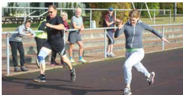
Laufen ist nur eine Möglichkeit von vielen beim Sportabzeichen.