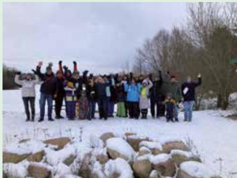
Vor der Wanderung hatten alle noch warme Hände und Füße ...

Mitgliedergewinnung steht beim TSV natürlich an erster Stelle. Am 21. Janu-