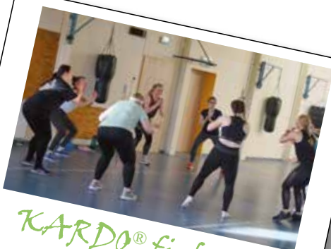
KARDO® fight fit

Mit 12 unterschiedlichen Kursangeboten hatten die Sportlerinnen und Sportler die große Auswahl. Wer motiviert war, konnte kostenfrei das gesamte Programm von 12 bis 16 Uhr nutzen. Aber 4 Kurse hintereinander, das haben sich nur wenige „angetan“. Denn es war schon anstrengend beim Fatburner Step, KARDO® fight fit, M.A.X.®, Sling Training oder Indoor Cycling. Und nicht zu unterschätzen: Auch beim Pilates kam man gut ins Schwitzen. Viele Kurse waren voll belegt – auch mit Teilnehmerinnen und Teilnehmern,