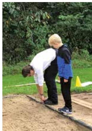
Vorbereitung zum Standweitsprung