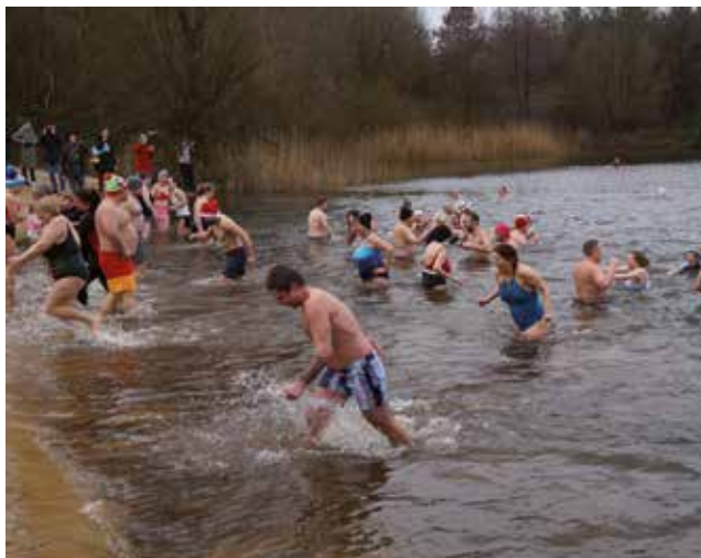
Schneller Rückzug aus dem kühlen Nass