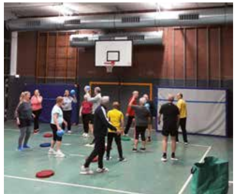
Gleitbewegung auf Teppichfliesen

Da die Organisation sich bei der Teilnahmemöglichkeit zum flexibleren Einstieg verändert hat, gibt es einen größeren Zulauf von Sportlern, die in flotten Schwüngen „Schneeberge“ hinunterwedeln möchten. Von Jugendlichen bis über 80-Jährigen ist alles dabei und jeder bekommt „sein Fett weg“. Das soll heißen, dass jeder seine individuelle Belastung selbst bestimmt. Unterschiedliche Übungsangebote machen das möglich. (Claudia)