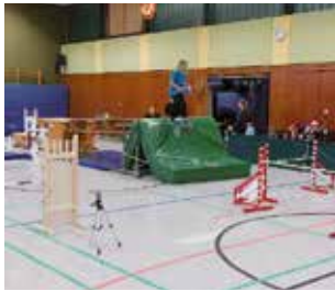
In Hoopte wurde das Hamburger-Derby-Rennen nachgestellt.

Mädels, Mädels, das war ein turbulentes Vierteljahr mit euch! Viele von euch haben an Turnieren teilgenommen, einige von euch sogar zum ersten Mal – Gratulation zur Feuertaufe! Ich kann euch sagen: Die Aufre-