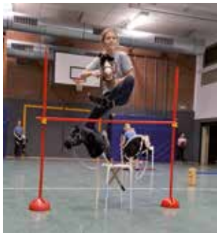
Nike fliegt beim Training hoch hinaus.

Wir trainieren übrigens in Todtglüsingern nach dem finnischen Regelwerk, dem Geburtsland des Hobby-Horsings. Dies