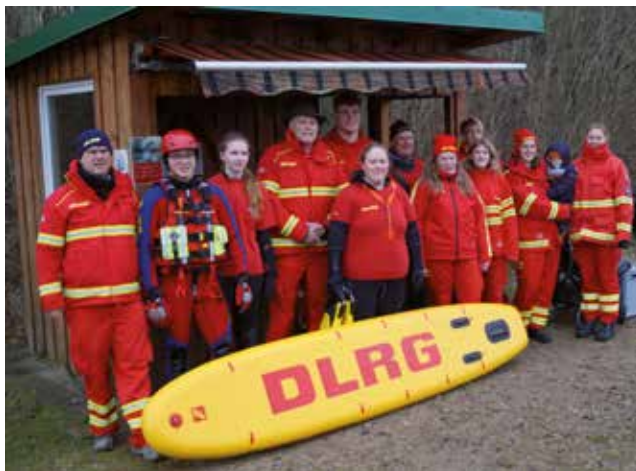
Die DLRG ist einsatzbereit!