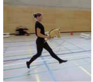
Bei einer Dressurkür ist Konzentration und Körperspannung gefragt.

ist nicht grundsätzlich so. Vor allem dort, wo das Hobby-Horsing in Reitvereinen stattfindet, wird auf viele sportliche Einzelheiten gar nicht so exakt geachtet, wie z. B. Biegung und Stellung des Hobby-Horses in den Kurven sowie aufrechte Körperhaltung und Fußstellung in der Dressur und im Stilparcours und die durchgängige Galoppade beim Zeitspringen und noch vieles mehr. Grundsätzlich gibt es derzeit in Deutschland auch zwei Ausrichtungen des Hobby-Horsing: Zum einen das von der Reiterlichen Vereinigung (FN) geprägte Hobby-Horsing, das vornehmlich dafür gedacht ist, die Kinder auf das Reiten vorzubereiten. Wir präferieren aber das gymnastisch-athletische Hobby-Horsing nach finnischem Regelwerk, das vornehmlich in Sporthallen oder auf Sportplätzen stattfindet. Um dieser Sportart mehr Ausdruck und vor allem ein umfangreiches Regelwerk zu verleihen,