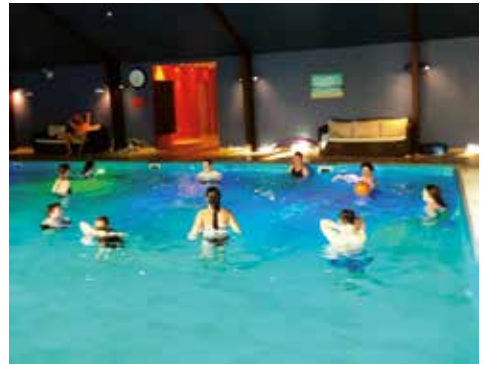
Auch Schwimmen steht regelmäßig auf dem Programm.