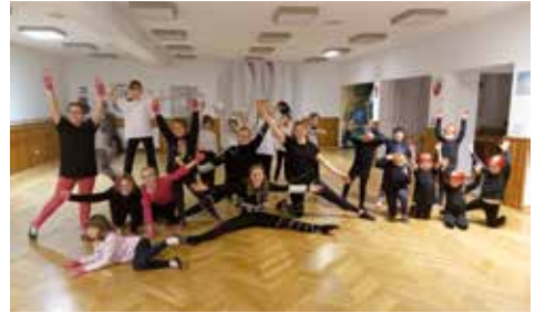
Die Teilnehmer der Weihnachtsaufführung im Hinkenwarns Hus

Auch bei den Kindern sind noch Plätze frei. Die hatten in diesem Jahr mit 4 Gruppen eine kleine Weihnachtsaufführung im Hinkenwarns Hus. Alle Stühle waren besetzt, und auch die Stehplätze wurden komplett von den Zuschauern belegt. Nach einer Generalprobe lief das Programm fast fehlerfrei durch. Es gab Feuerwehrgymnastik, Piratentanz, Maschinen und die 7- bis 11-Jährigen machten die Zuschauer mit „make you happy“ glücklich.