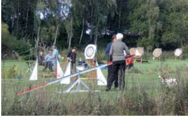
Nette Nachbarschaft: Hundesport und Bogensport

der Trainingsplatz wegen Drainagearbeiten nicht zur Verfügung, weshalb die Hundesportler mit Hunden und Geräten zum Trainieren auf den Friedrich-Wiechern-Platz ausgewichen sind. Oft werden wir nach dem neuen Vereinshaus am