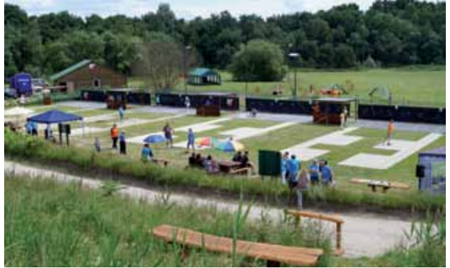
Norddeutschlands schönste Gorodkianlage

Endlich ist der Sommer da und lockt uns aus den vier Wänden nach draußen. Baden, Wandern und Chillen am Baggersee sind jetzt angesagt. Damit ihr dort eure Freizeit genießen könnt, haben wir zum Sommerbeginn die Wanderwege ausgebaut, neue Sitzgruppen und Bänke aufgestellt und die Strände mit frischem Sand aufgefüllt. Am Baggersee können viele Sportarten ausgeübt werden, wobei man natürlich auch erstmal zuschauen kann, etwa beim Gorodki , nämlich am 9. Juni 2018 bei der Niedersächsischen