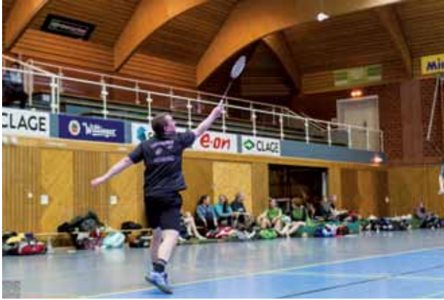
Geballte Kraft bei der Rückhand

von drei Damen und fünf Herren, alle ausgeschlafen, gesund und fit – beste Voraussetzungen! Diese wandelten wir dann auch in einen souveränen Sieg gegen den MTV Pattensen um. Danach stellten wir uns unserem größten Konkurrenten TSV Stelle, der uns zuletzt schmachvoll 3:5 in Klecken geschlagen hatte! Wir waren aber so motiviert und beflügelt, dass wir uns mit dem Minimalstieg von 5:3 nicht zufrieden gaben, sondern