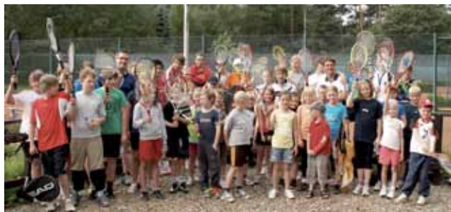
Beliebtes Highlight: Tenniscamp