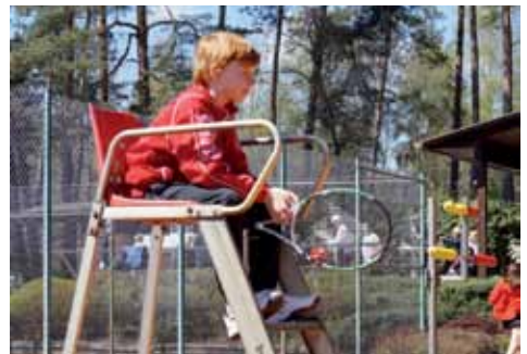
... werden vom Nachwuchsschiedsrichter beäugt.