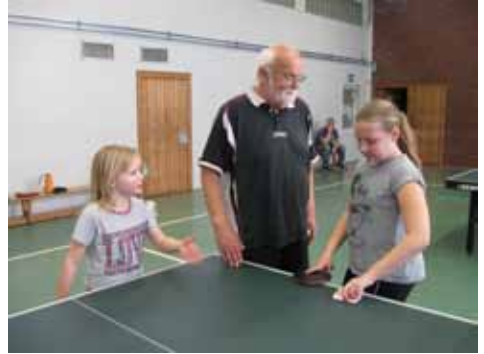
Zeit für Verbesserung, aber mit einem zwinkernden Auge ;-)

Die Schüler-Mannschaft konnte gebildet werden, und sie hat auch ihre ersten Erfahrungen gesammelt und Erfolge