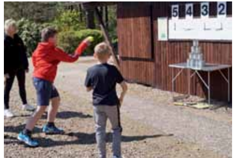
... als auch drumherum.

Clubhaus waren rechtzeitig fertiggestellt worden.