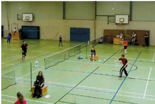
Tim (rechts) kämpft im Jungeneinzel U17

Im Anschluss an die Punktspielsaison, in der ausschließlich in Mannschaften gespielt wird, beginnt immer gleich die Turniersaison . Hier sind die Teilnahme einzelner Spieler in allen Disziplinen (Einzel, Doppel und Mixed) und auch vereinsübergreifende Kombinationen möglich. Das erste Turnier in der Saison mit Teilnahme des Todt-