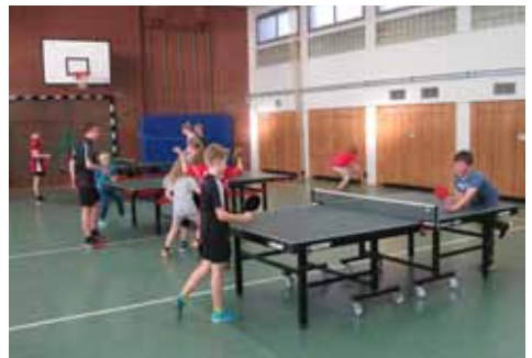
Die Übungen werden mit Spaß umgesetzt.