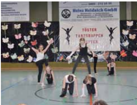
12- bis 14-Jährige