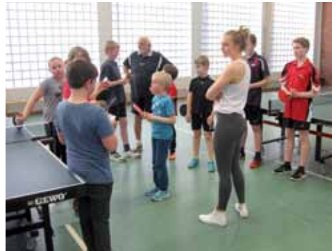
Die nächsten Übungen werden erklärt und zwischendurch etwas Regelkunde. Da ist man dann auch mal geschafft.