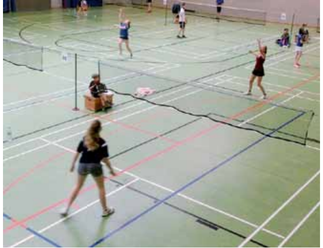
Jenny (rechts) kämpft im Mädcheneinzel U17

kämpften sich unverdrossen mehrere Stunden durch ihr jeweiliges Spielfeld. Nach einigen Spielen erstritt sich Tim als fast Jüngster im U17-Jungeneinzel den 6. Platz von 12 Spielern und Jenny den 5. Platz im U17-Mädcheneinzel von insgesamt 7 sehr starken Mädels! Hut ab und Glückwunsch ihr Beiden zu euren ersten Ranglistenpunkten!