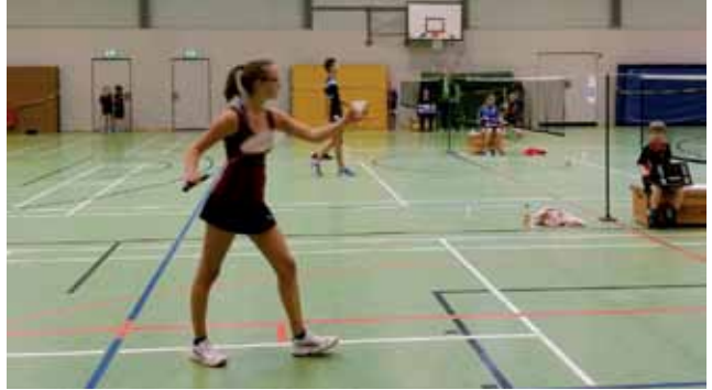
Konzentration ist das Wichtigste beim Aufschlag

2016/2017 ist im März mehr oder weniger erfolgreich zu Ende gegangen. Die beiden Seniorenmannschaften hatten diese Saison eher mäßigen Erfolg, der hauptsächlich personelle Gründe hatte. War doch sowohl die erste Mannschaft als auch die zweite Mannschaft von Spielerausfall so stark gebeutelt, dass wir uns nicht einmal gegenseitig unterstützen konnten. Aller widrigen Umstände