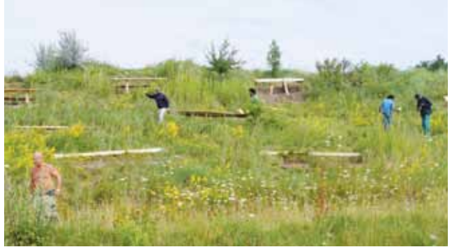
Tribünenbau am Baggersee für die Gorodkianlage

schaffen durch die tägliche Mitarbeit von durchschnittlich 12 bis 22 Flüchtlingen . Unter sachkundiger Anleitung von Konny, Klaus, Thomas, Michael und Ronny wurden sie auch mit ungewohnten und schwierigen Aufgaben vertraut gemacht. Zurzeit sind mehr als 140 Flüchtlinge aus 14 Ländern zahlende Mit-