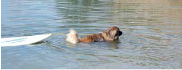
Apportieren mal anders

geht am besten mit hoher Stimmlage und reichlich Körpereinsatz. Ja, ein bisschen verrückt muss man sein, wenn man Wasserarbeit betreiben möchte.