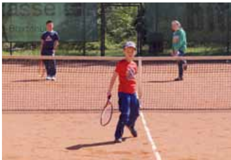
Die Nachwuchsspieler auf dem Platz ...