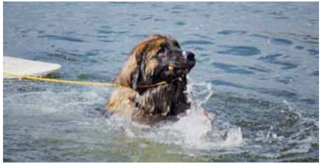
Badespaß für die Vierbeiner