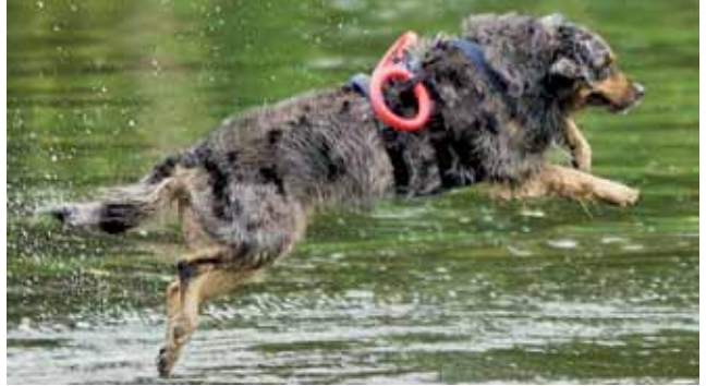
Und ab ins kühle Nass

Die Hunde lernen so nach und nach viele verschiedene Übungen z. B. wie man einen Menschen