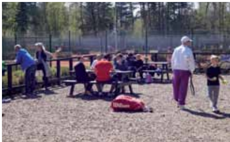
Die Gäste genießen das schöne Wetter.