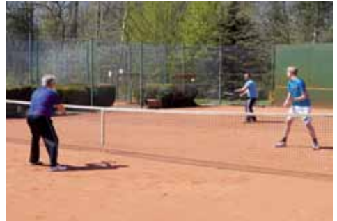
Action sowohl auf den Plätzen ...