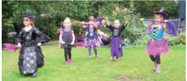
Kleine Hexen tanzen

Den nächsten Auftritt absolvierten J-Dato und die Erwachsenen. Ein Mitglied beider Gruppen hat geheiratet und natürlich sollte es