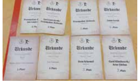
Die TSV-Ausbeute bei den Erwachsenen-KM

Im Doppel traten Przemek und Louis zusammen gegen die 4 anderen Dop-