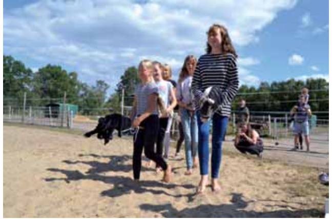
Die Mädels führen beim Hoffest eine Quadrille auf.

Hobby-Horsing, die neue Trendsportart aus Finnland, setzt sich mehr und mehr in Deutschland durch! Das Fieber der Stockpferde hat längst viele Kinder und Jugendliche aus unserem Land erwischt und lässt sie nicht mehr los! Auch im Todtglüsinger SV verzeichnen wir laufend neue MitgliederInnen unserer neuen Abteilung. Das ist auch kein Wunder, denn es ist gleichsam ein Schnelligkeits- und Ausdauersport, gepaart mit einer Menge Spannung, Spiel und Spaß. Wer einmal bei einem zackigen Zeitspringen, einer schön einstudierten Dressur, einem eleganten Stilspringen oder einem Hochgeschwindigkeits-Barrel-Race zugeschaut hat, der weiß es ganz genau: Es macht einen Mordsspaß und gibt den Kindern wieder eine neue Möglichkeit, sich zu bewegen, sich zu messen