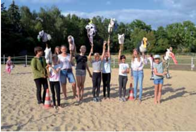
Es war ein schönes Hoffest in Königsmoor.