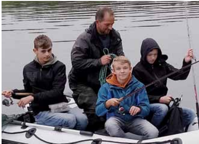
Abschiedsangeln auf dem Baggersee

Zusätzlich zu den regulären Terminen konnte dieses Jahr auch wieder ein Nachtangeln mit der freundlichen Unterstützung einiger Altangler abgehalten werden.