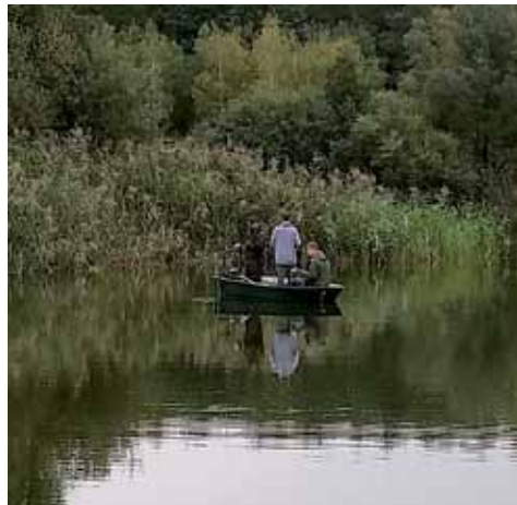
Idylle auf dem See

denn zum Angeln gehört nicht nur die „Maden zu baden“, sondern auch der artgerechte Umgang mit Fischen, Naturschutz, spezielle Gesetzeskunde und noch einiges mehr.