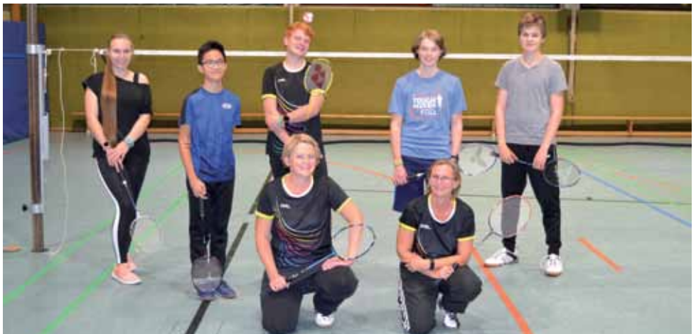
Verbliebene Jugendspieler nach der Corona-Zwangspause