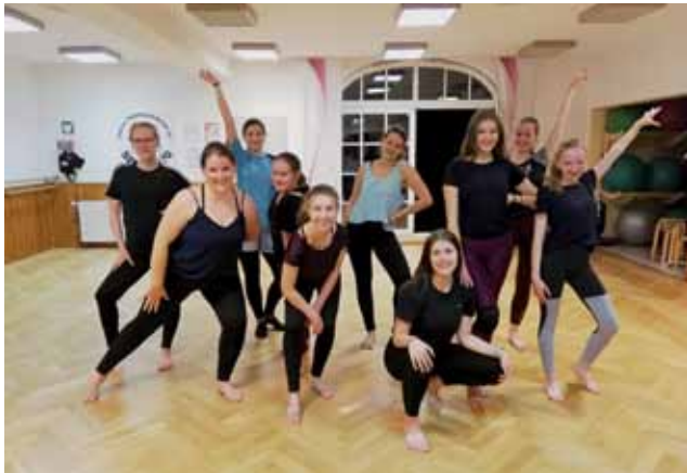
J-Dato stellt sich schon mal in Pose.

Die neue Gruppe kreativer Kindertanz für 4- bis 5-jährige Tanzanfänger ist sehr gut angelaufen. Wir nehmen aber gerne noch neue Tänzer auf. Trainiert wird Montags von 16.15 Uhr bis 17.00 Uhr. Plätze frei sind auch in der Gruppe der Grundschulkinder von 6–9 Jahre am Dienstag von 17.00–17.45 Uhr und bei den 5- bis 6-Jährigen am Mittwoch von 17.00–17.45 Uhr.