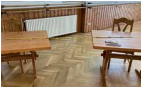
Abstand wird gewahrt

Laut Gesundheitsamt dürfen mehr als 6 Teilnehmer*innen trainieren, solange die Abstände eingehalten werden können. Bitte auf jeden Fall vorher anmelden!