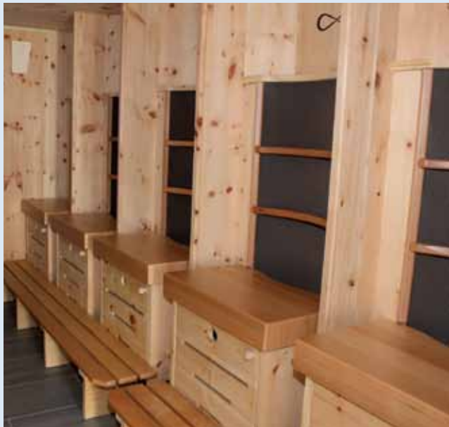
Hydro-Soft-Sauna (Infrarot) im HAS-Wellnessbereich

Tanzhaus bei der Geschäftsstelle für ihre Aktivitäten zur Verfügung gestellt. Zuständig für Anfragen und Anmeldungen in diesem Bereich ist Jutta Dülsen (Telefon 0 41 82/75 92).