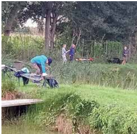
Angeln am Spring