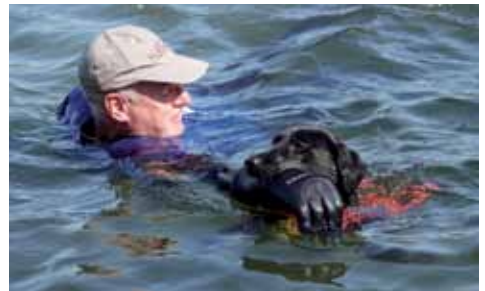
... und dann am Menschen.