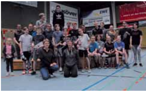
Jugend heute – Weihnachtsturnier 2018