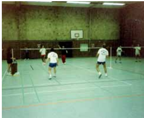
Hoffmann-von-Fallersleben-Cup 1989 – das erste große Turnier