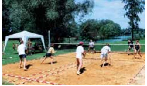
Beachmintonturnier 1999 in Rain a. Lech