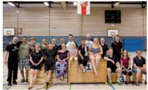
Nordheidecup 2018 – Orga-Team