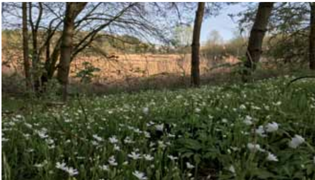
Pure Natur am Baggersee!