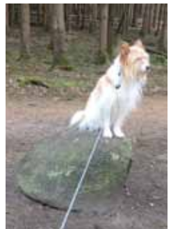
Das „0“ klappt schon mal prima.