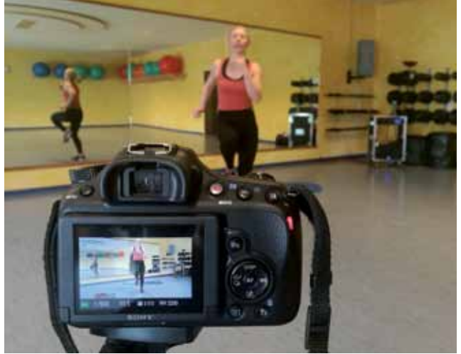
Videoaufnahmen für unsere Mitglieder

Wir sind auch auf Instagram und Facebook aktiv