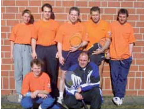
1. Mannschaft 2003