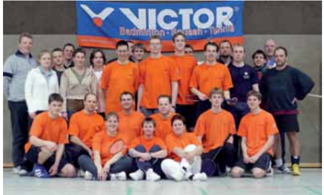
Freundschaftsturnier 2005 – Der Vorläufer zum heutigen Nordheide-Cup, der 2007 startete

dämlichen Virus!!! Das stehen wir jetzt gemeinsam durch und danach, wie lange es auch immer dauern mag, wird alles irgendwie wieder so wie früher – eben nur anders! Das ist aber immer so – schon seit 40 Jahren! Bitte bleibt gesund und ich freue mich sehr, von euch zu hören, auf welchem Weg auch immer! (eB)