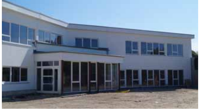
Unser Neubau – jetzt ohne Gerüst

Die Vorfreude war groß: Eigentlich hätte das Vereinshaus „Haus am See“ im Frühsommer in Betrieb genommen werden sollen. Zunächst lief alles nach Plan: Sämtliche Bauarbeiten waren so koordiniert, dass Mitte Mai die Eröffnung hätte erfolgen können. Die beteiligten Unternehmen und Handwerker haben ihre Aufträge zeitgerecht erledigt. Dann aber hat die Corona-Krise bei manchem Lieferanten zu Engpässen geführt, so dass mit der Fertigstellung voraussichtlich erst