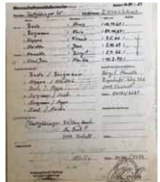
Die erste Mannschaftsmeldung 1988